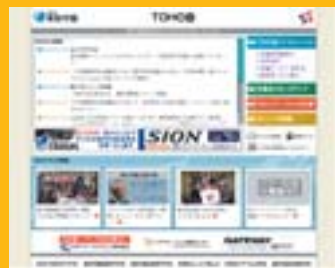
TOHO会ウェブサイトTOPページ

卒業生の耳寄り情報やキャンパスニュース、TOHO会からのお知らせをいち早くお届けします。