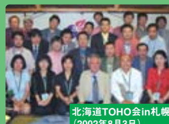
北海道TOHO会in札幌 (2002年8月3日)