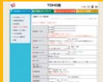
メールアドレス登録ページ

あなただけの“×××@tohogakuen.com” メールアドレスを無料で発行いたします。