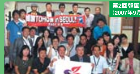
第2回韓国交流訪問 (2007年9月8日)