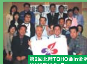
第2回北陸TOHO会in金沢 (2007年12月1日)