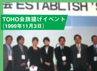
TOHO会旗揚げイベント (1999年11月3日)

1999年11月のTOHO会旗揚げから10年。 日本全国そして海外にも 東放学園卒業生の輪が広がっています。