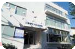
2008年 東京アナウンス学院 (中野校舎)