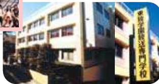
1996年東放学園放送専門学校（早稲田校舎）