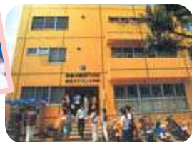
1985年東京アナウンス学院（中野校舎）