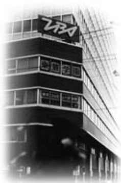
1970年(昭和45年)当時の TBSコンピュータ学院