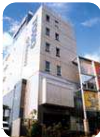
2004年東放学園専門学校