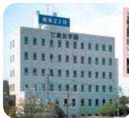
1982年 東放学園専門学校