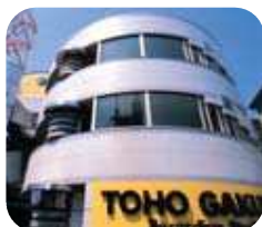
1993年東放学園音響専門学校 (渋谷校舎)