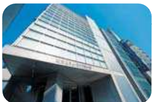
2004年東放ミュージックカレッジ