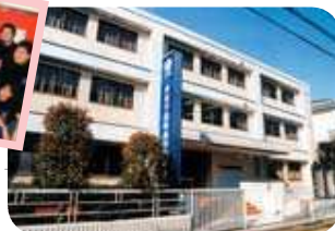
2005年 東放学園映画専門学校 (早稲田校舎)