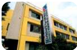
1988年アカデミー オブビジネス専門学校 (早稲田校舎)