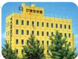
1985年東放学園専門学校