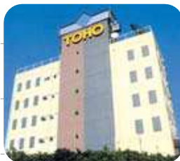
1993年東放学園専門学校