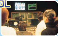
レコーディングディレクション