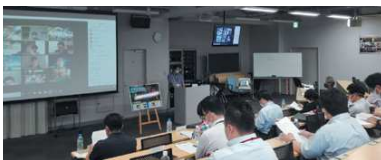
ZOOMを使って行われた定時総会の様子

先だて行われました第21回TOHO会定時総会におきまして、今年度の事業計画として以下の場所での地域TOHO会が計画されました。しかしながら現在の状況を鑑み開催日は未定となっております。今後、実施が可能になりましたらTOHO会のホームページ等で詳細を皆様にお知らせして参ります。