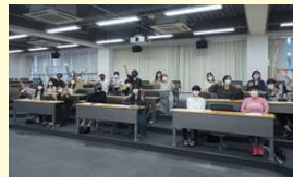
ソーシャル・ディスタンスを保って説明会が行われました