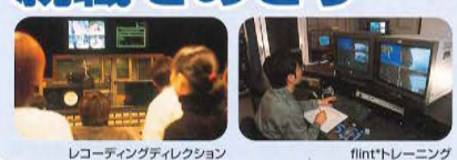
レコーディングディレクション