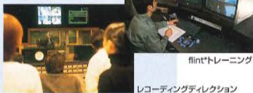
レコーディングディレクション