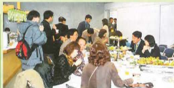
2会場に分かれてのフリータイム。会場には座敷コーナーも設けられました。