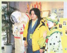
エントランスでピエロと一緒にポラロイド撮影