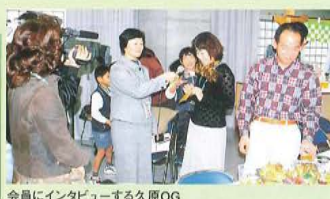
会員にインタビューする久原OG