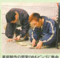
美術制作の雨宮OBもピンゴに熱中