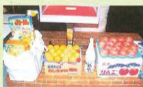
代表役員から提供して頂いた ふるさと名産品などの数々