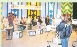
スタジオでのリハーサルにも気合が入ります