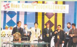
ピンゴの最終戦は 会場からスタジオ に場所を移して行 われました