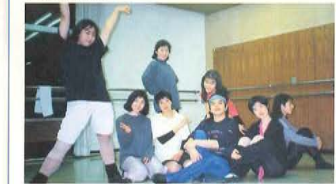
1994年放送演技術科卒業のメンバーと

アナ学でクラシックダンス、ジャズダンスを教えたのは今から13年前のこと。「アナ学との縁はミュージカルがきっかけです。ゼミのメンバーを中心に始めた『ヤングアンサンブル21』で、糧食を共にしながら(?)、郷土芸能を引用した創作ミュージカルを学校や地方で上演しました。その時のメンバーが今でもダンスを教えたり、この業界で頑張っているんですよ。」「日本民族舞踊団に所属してはや30年。来年は公演で東欧に行く予定です。」という沢田先生。会員の皆さんに「人間は中身をみがついて、紙一重に挑戦!」というメッセージを頂きました。