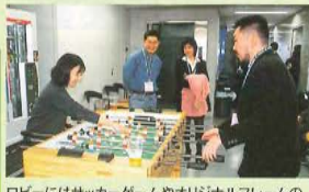
ロビーにはサッカーゲームやオリジナルフレームの ブリクラが用意されました