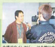
会場でのインタビューは全館に中 継されました(インターネット放送も 同時中継)