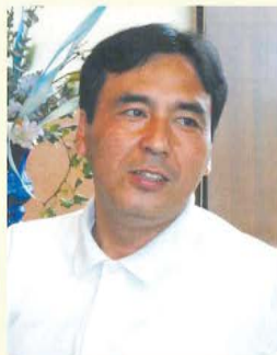
映画監督 鹿島 勤(1977年卒)