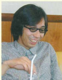
映画監督 行定 勲(1989年卒)