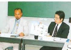
小河原会長からは、カラー版になったColorful創刊2号の説明がありました。