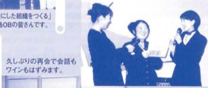
久しぶりの再会で会話もワインもはずみず。