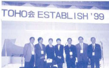
TOHO会 ESTABLISH '99