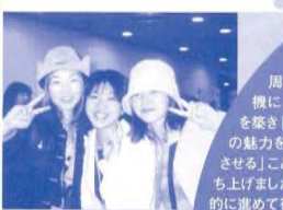
「先生ひさしぶりー」