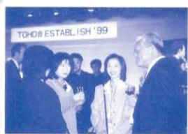
TOHO会 ESTABLISH '99