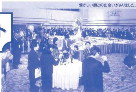
懐かしい顔との出会いがありました。

平成11年11月3日(水)・文化の日 会場:京王プラザホテル(新宿) エミネンスホール ○ 12時～2時間、200名を超える卒業生とそのご家族が集い、なごやかなランチタイムを過ごしました。