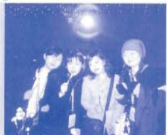
次のTOHO会でもまた会いましょう!