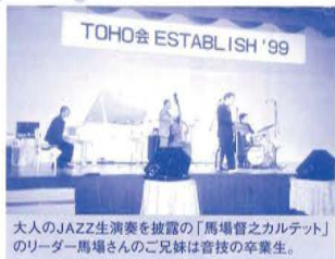
TOHO会 ESTABLISH '99