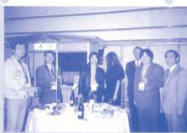
卒業生ごと、12色に色分けしたテーブルを囲んで。