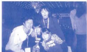
ご家族での参加も多数ありました。